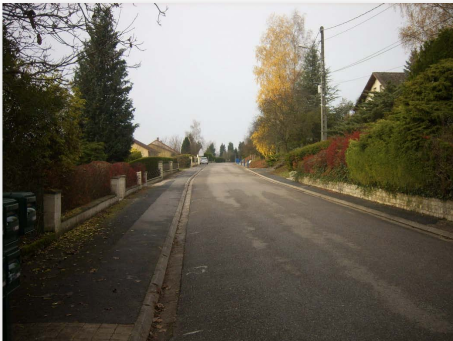
- L'entrée ouest d' Allamps aujourd'hui -

Lorsque, venant de Vannes le châtel , on pénètre dans Allamps par la D4A, on est agréablement surpris par la perspective.