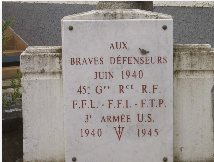
- La plaque commémorative -