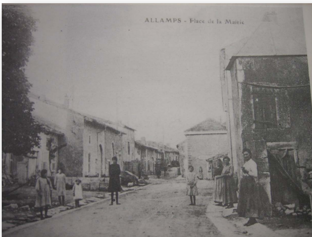
- La rue haute au début du siècle dernier -

Dans sa partie originelle, elle s'appelait « rue haute » et se prolongeait jusqu'à la sortie est, formant alors, avec l'actuelle rue Pasteur , un ensemble continu, harmonieux, délicieusement rustique et authentiquement lorrain.