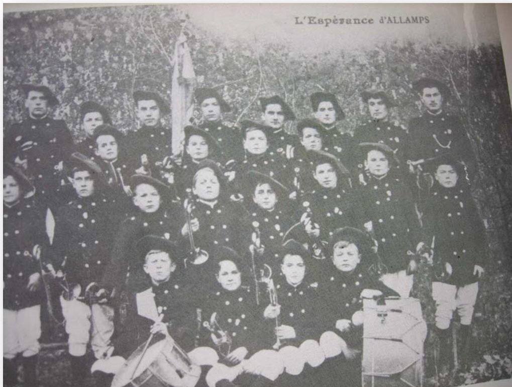
- L'Espérance d'Allamps en 1910 -

C'est là aussi que répétait et jouait la fanfare municipale, la fameuse « Espérance d'Allamps » qui, durant de longues années, anima les manifestations locales et donna des aubades très appréciées du public.